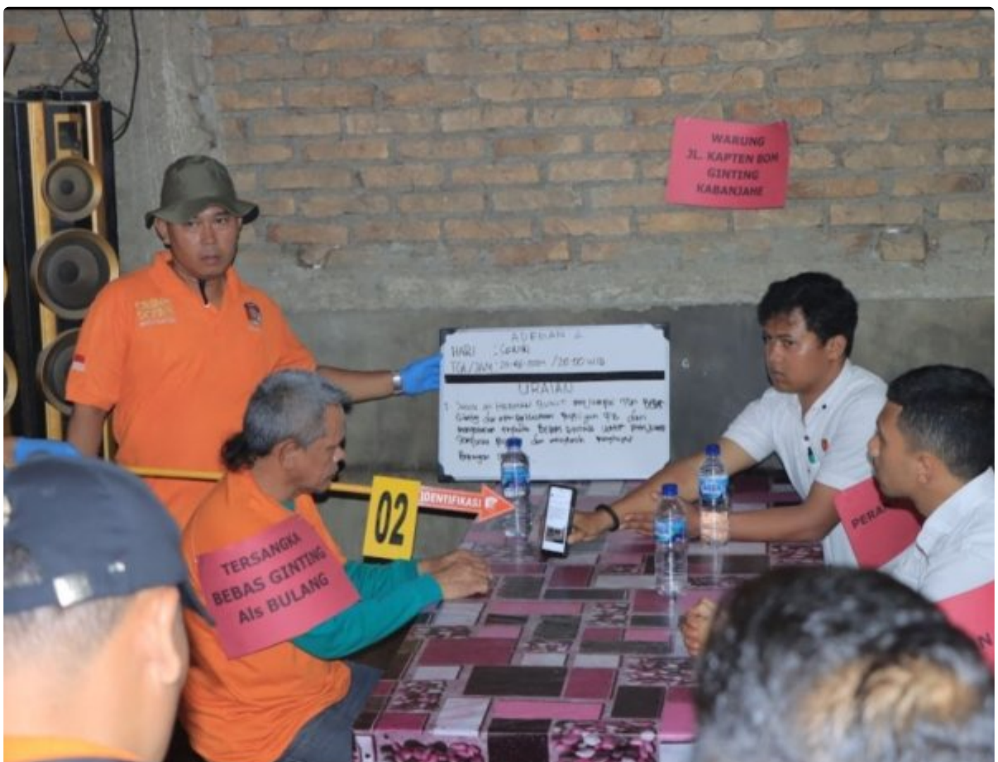
Koptu HB dalam adegan rekonstruksi hanya diperagakan peran pengganti, Jumat (19/07-2024) di warung Jalan Kapten Bom Ginting Kabanjahe

MEDAN -- Kasus pembakaran rumah yang menewaskan wartawan Tribrata TV Rico Sempurna Pasaribu dan tiga anggota keluarganya, Kamis (27/06/2024) dini